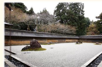
17 日本庭園/178 枯山水 (龍安寺 石庭)

全収録キーワードをネイティブが英語で読み上げる DVD付き。リスニング教材にも最適。